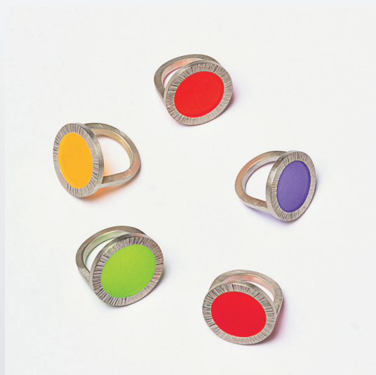
Paul Derrez 'Radiant' ringen zilver, acrylaat 2021